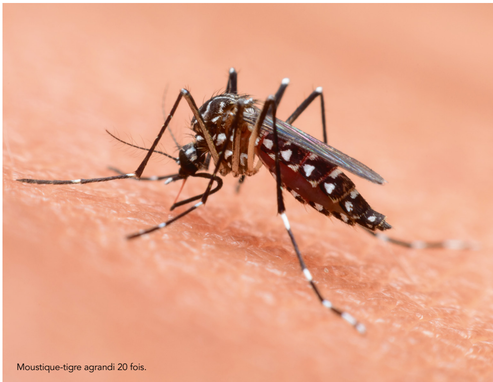
Moustique-tigre agrandi 20 fois.

S'il appartient avant tout à chacun d'adopter le réflexe de supprimer tout gîte larvaire, c'est dans le cas de la déclaration d'une personne malade (laquelle revient d'un pays où elle s'est faite contaminer) que la démoustication par traitement chimique est pratiquée, uniquement sur un espace restreint, autour de son habitation. Ponctuelle et localisée, celle-ci est décidée par l'ARS pour le compte du préfet qui en confie la réalisation au Conseil départemental, lequel délègue cette compétence à un opérateur : l'Entente Interdépartementale pour la Démoustication du littoral méditerranéen (EID Méditerranée). Enfin, à grande échelle, cette démoustication n'est pas recommandée car elle aggraverait le phénomène en renforçant l'immunité du moustique-tigre d'une part, et n'a aucun effet ni sur les œufs, ni sur les larves, d'autre part.