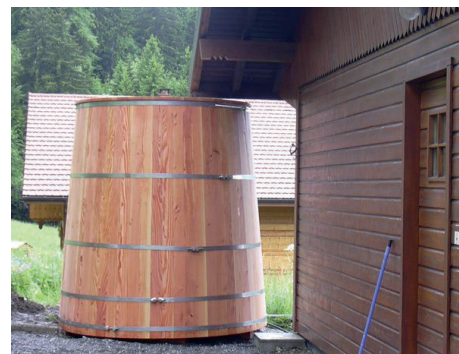
Protéger les récupérateurs d'eau par une moustiquaire