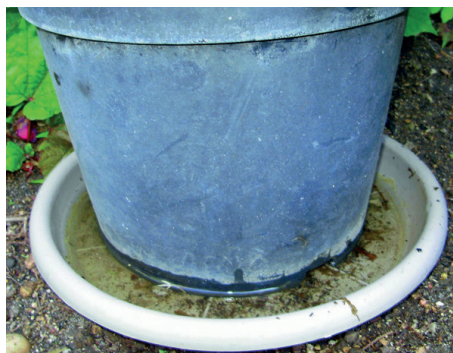
Mettre du sable dans les dessous de pots