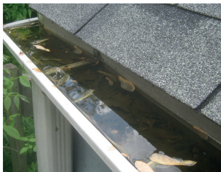
Déboucher les gouttières