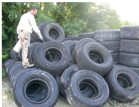
Vider et protéger les pneus