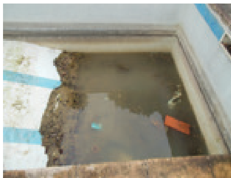
Vider et protéger les bassins

Eliminer l'eau stagnante qui peut servir de gîte larvaire.