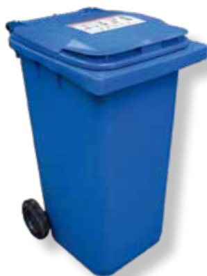
Emballages et papiers recyclables

Si à l'usage, après le 18 mars, il s'avérait que la capacité de votre bac n'était pas adaptée à votre production de déchets, celui-ci pourrait être changé (pour un volume de bac adapté) en appelant le 05 61 222 222.