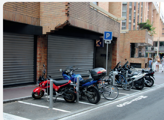
Sept nouvelles places sécurisées rue Fonvieille.

Exemples de configuration d'emplacements motos :