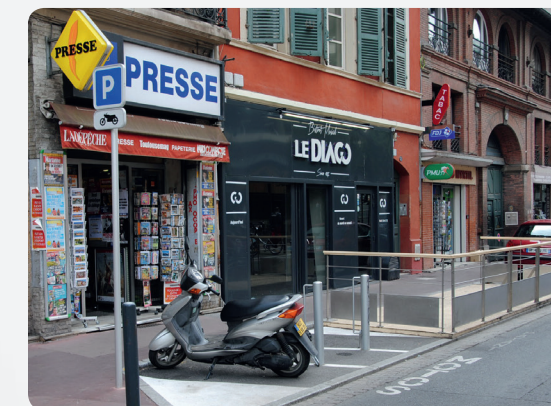
Trois nouvelles places sécurisées place des Carmes.

Les deux-roues motorisés disposent de plus de 600 places de stationnement gratuit sur voirie dans le centre-ville de la Métropole. Celles-ci sont indiquées par une signalisation horizontale ou verticale.