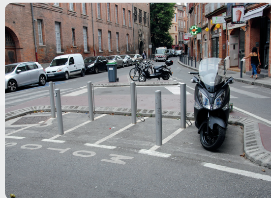
Huit nouvelles places sécurisées rue Gambetta.

➤ Par ailleurs de nouveaux emplacements sont progressivement aménagés, pour densifier et mieux équilibrer l'offre de stationnement en centre-ville.