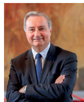
Jean-Luc Moudenc Maire de Toulouse Président de Toulouse Métropole