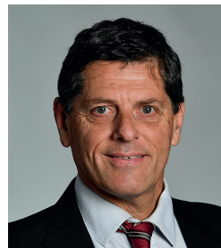
Thierry Sentous Mobilier urbain (Abris bus, bancs publics...) Publicités