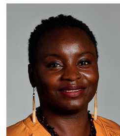
Gnadang Ousmane Démarches administratives Naissances Décès