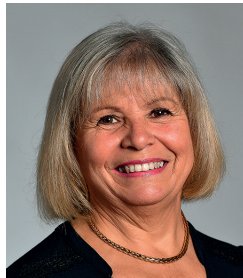
Françoise Ampoulange Animaux dans la ville Fleuve, canaux