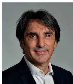
Pierre Espuglas Labatut Musées, Cinéma