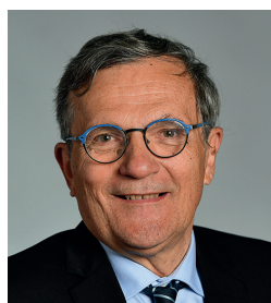
François Chollet Qualité de l'air intérieur et extérieur