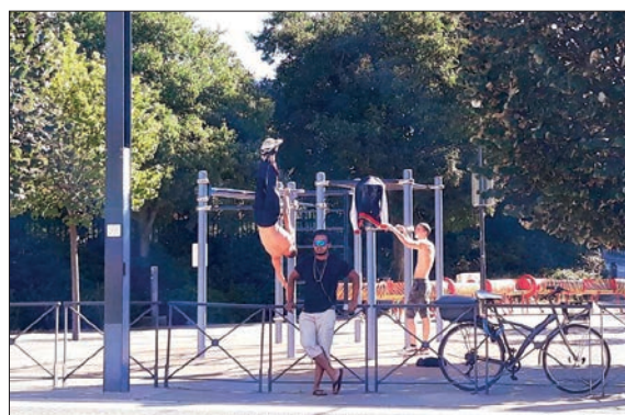
Aire de street work-out aux Arènes