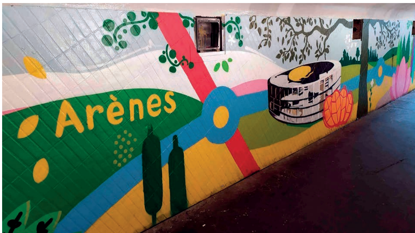
Projet de fresque réalisé dans le souterrain du bd Koenigs