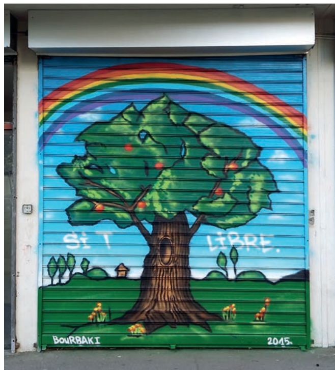
Local de l'association « Si T Libre »

Des objectifs du Contrat de Ville à court terme seront de conforter l'implantation d'associations au cœur de cette cité, d'y développer les services d'accès aux droits, et de poursuivre le suivi de l'insertion socio-professionnelle des jeunes.