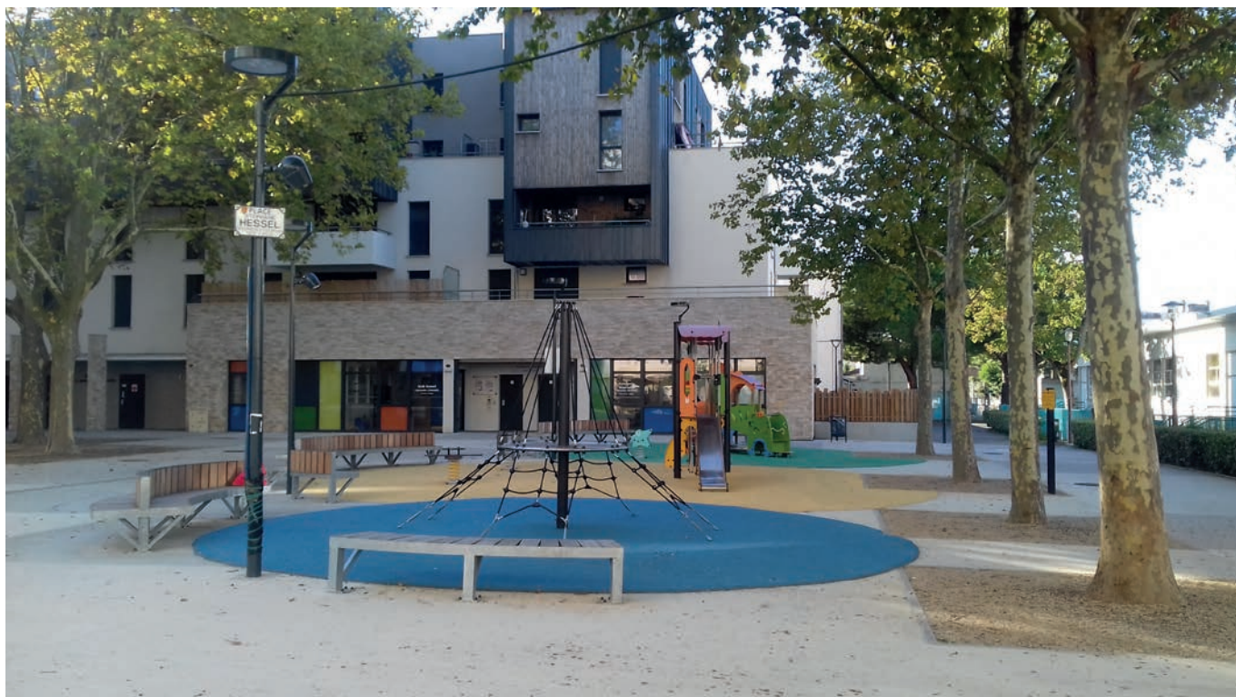
Place Stéphane Hessel