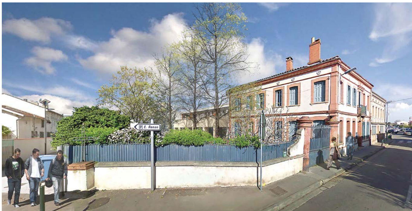
Futur accueil jeune au 95 rue Ernest Renan