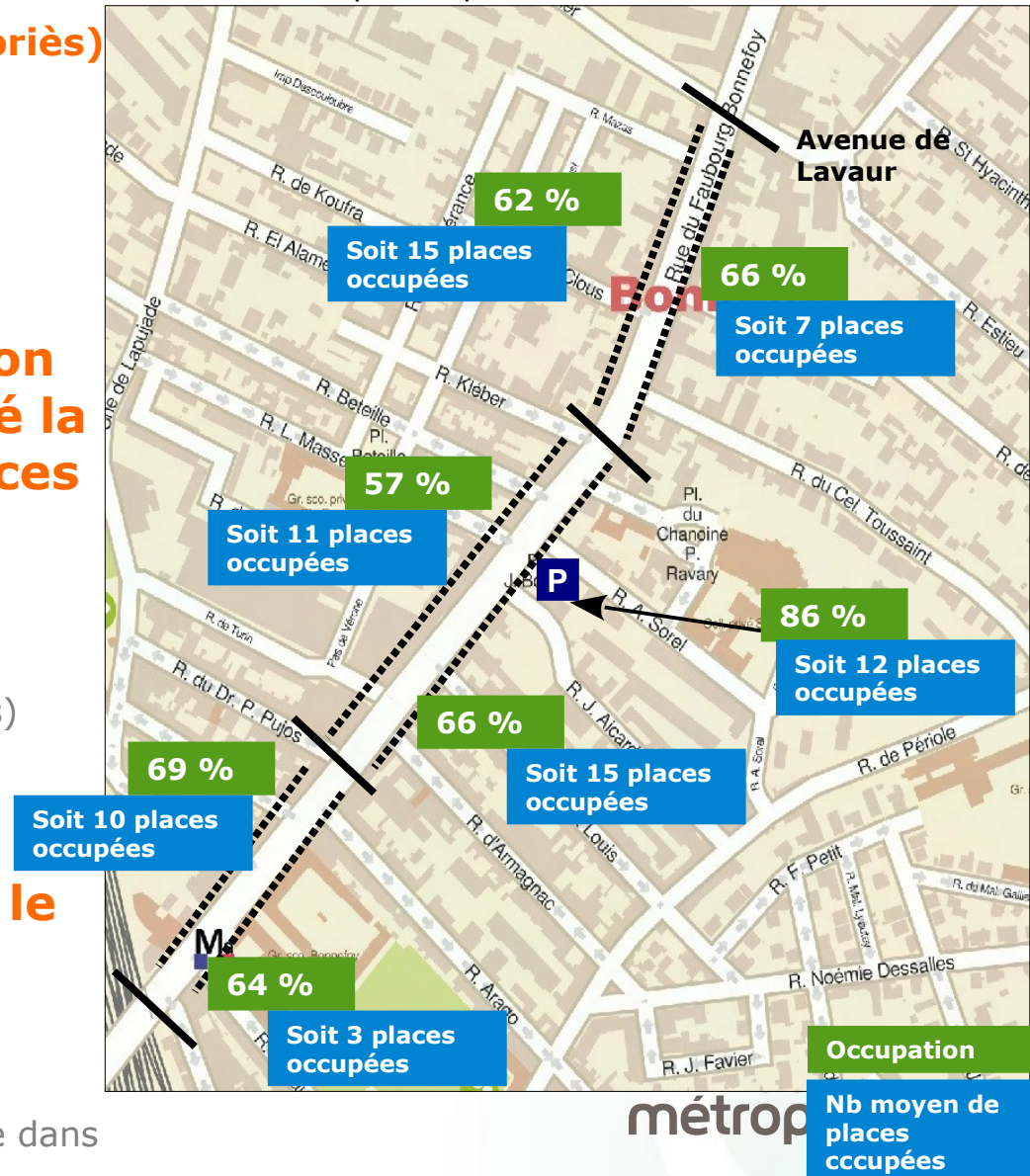
Occupation par sens de circulation