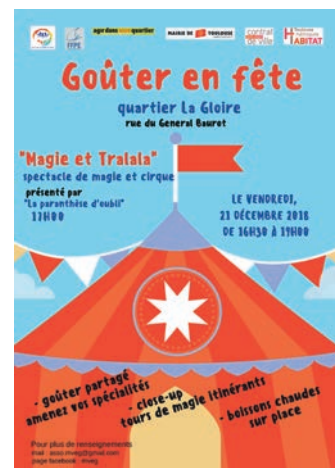
« Goûter en fête » en décembre 2018, organisé par l'association MVEG avec l'aide du dispositif Agir Dans Mon Quartier