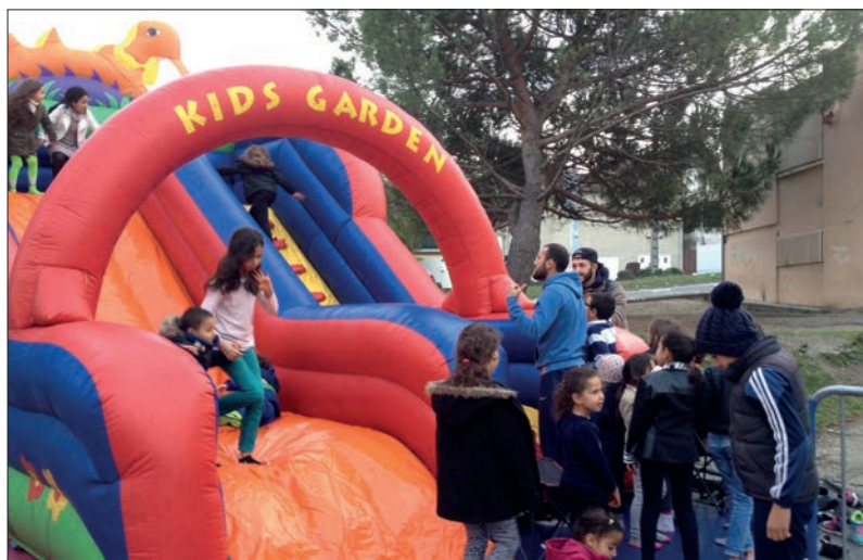
Animation en 2014 par ACCEPPT et Agir et devenir.