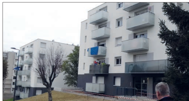
Les logements réhabilités contribuent également à changer l'image de la cité.

Des habitants du quartier de la Gloire ont constaté qu'il n'y avait pas de structure juridique pour se rassembler et construire des projets pour le quartier. Avec l'aide du Conseil Citoyen ils ont créé deux associations, dont Mieux Vivre Ensemble à la Gloire (MVEG) pour organiser des animations et des temps conviviaux sur le quartier.