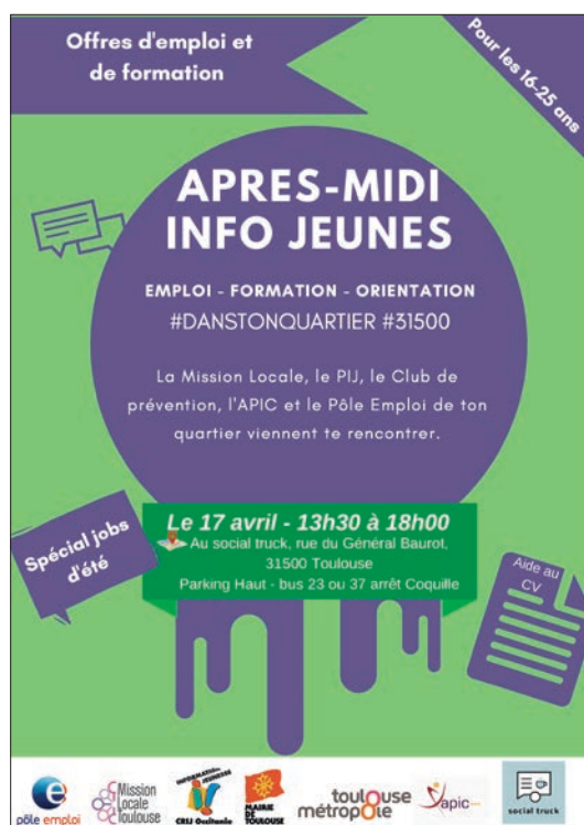
Après-midi info jeune.