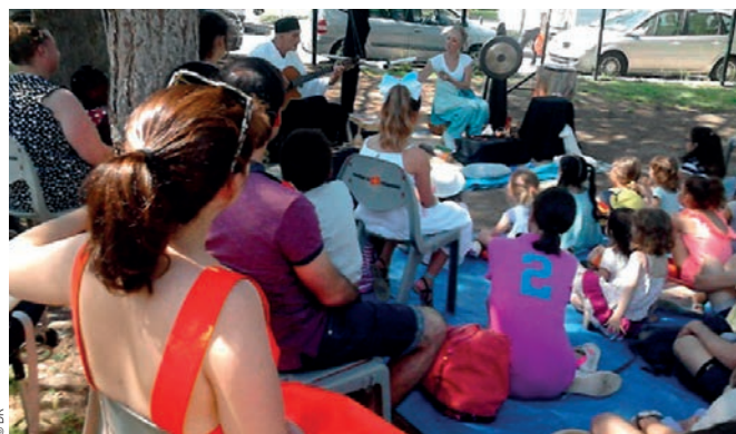
© DR Action Agir Dans Mon Quartier Juin 2017

Des processus de concertation avec les habitants et les associations sont engagés depuis 2010, sur les différents projets d'aménagement urbain. Dans le cadre du projet Cœur de quartier, il est question de donner une plus grande ambition à la place Soupetard au centre de la rue Louis Plana avec la relocalisation possible de certains commerces. La création d'un espace public plus important permettrait une séquence d'ouverture sur cette rue étroite et serait également l'occasion de créer des cheminements vers la zone verte des Argoulets en cours de réaménagement.