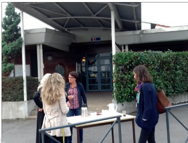
À la rencontre des parents des école de Soupetard en septembre 2017