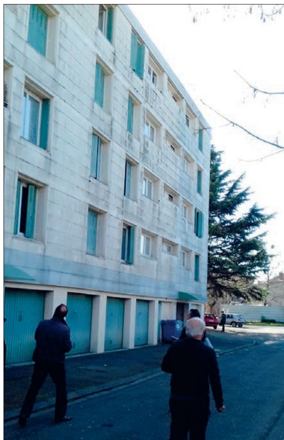
Diagnostic en marchant printemps 2017 cité avenue de l'hers