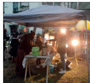
Goûter à la résidence de l'Hers en décembre 2018 organisé par les équipes du projet Ami Chemin, en partenariat avec ICF Habitat et le Club de Prévention

La Ville de Toulouse a également lancé un Appel à projet Culture - Politique de la Ville pour construire, avec les lauréats et les partenaires du territoire, un projet de saison culturelle en 2019 sur les quartiers Soupetard et La Gloire.