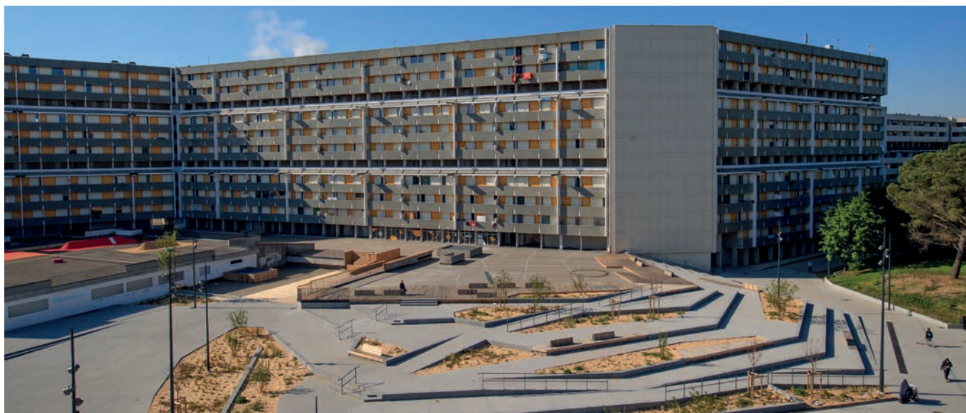
Place Niki de Saint-Phalle