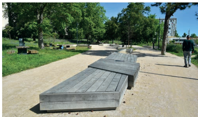
Le Petit Bois