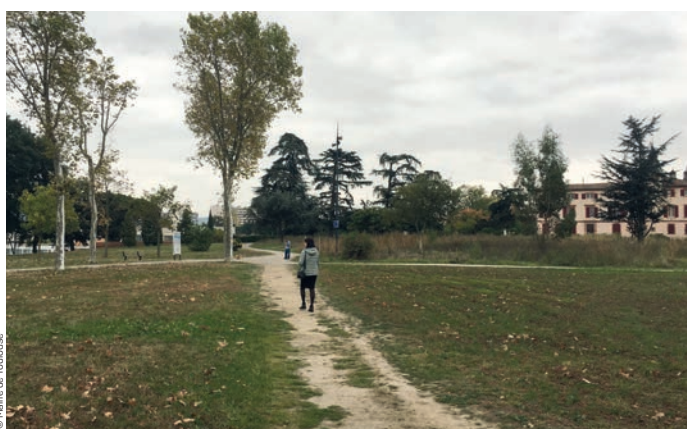
Parc du Mirail