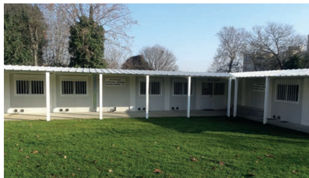
Centre Social Alliances et Cultures