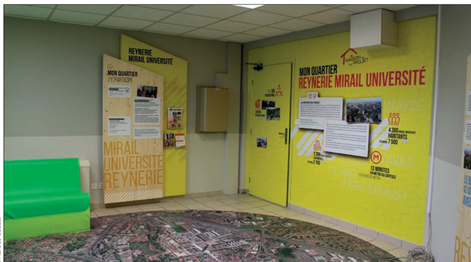
La Maison du projet de Reynerie au sein de l'Espace du Lac