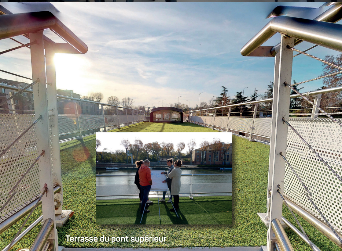
Terrasse du pont supérieur