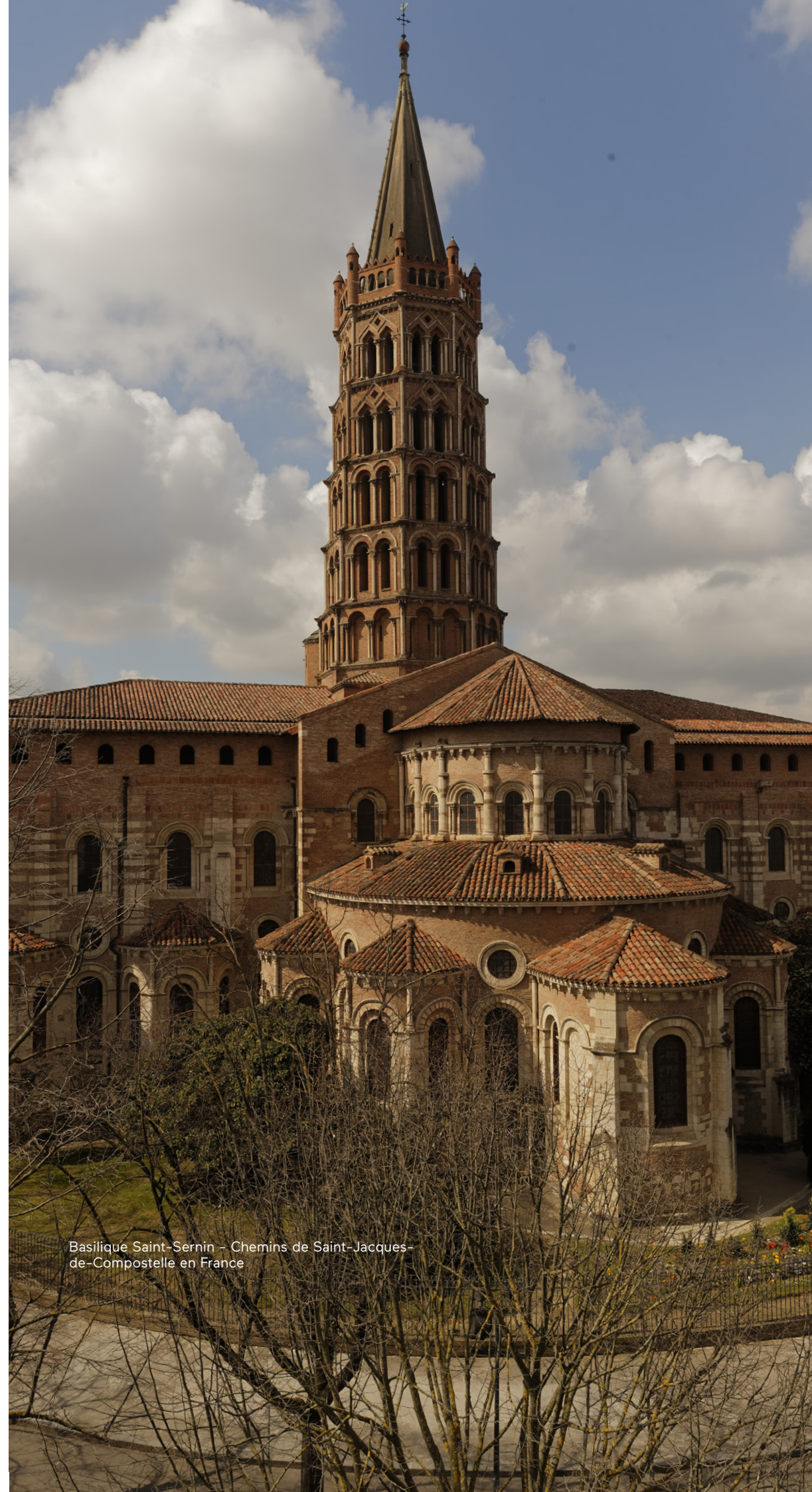
Basilique Saint-Sernin – Chemins de Saint-Jacques-de-Compostelle en France