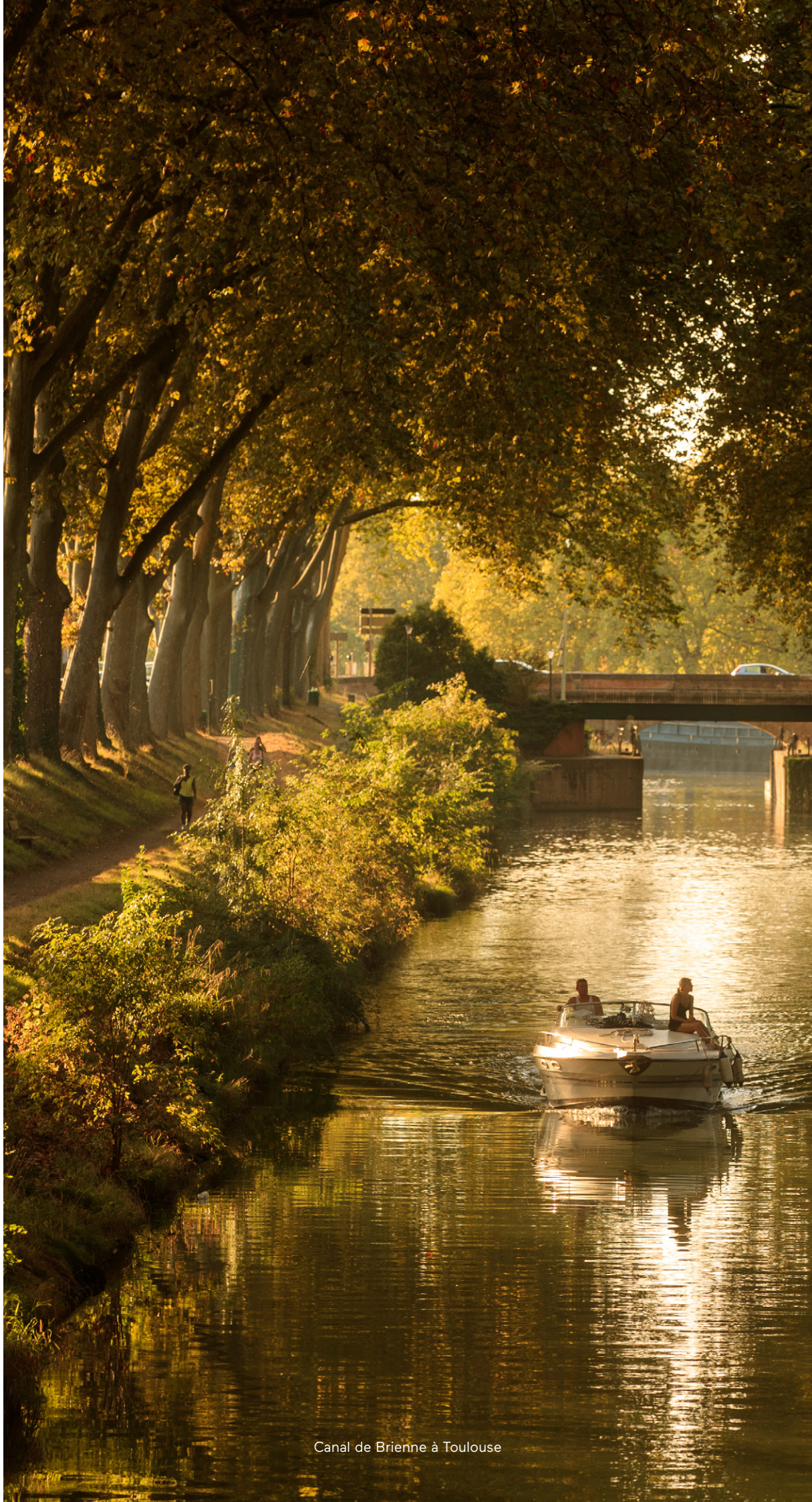
Canal de Brienne à Toulouse