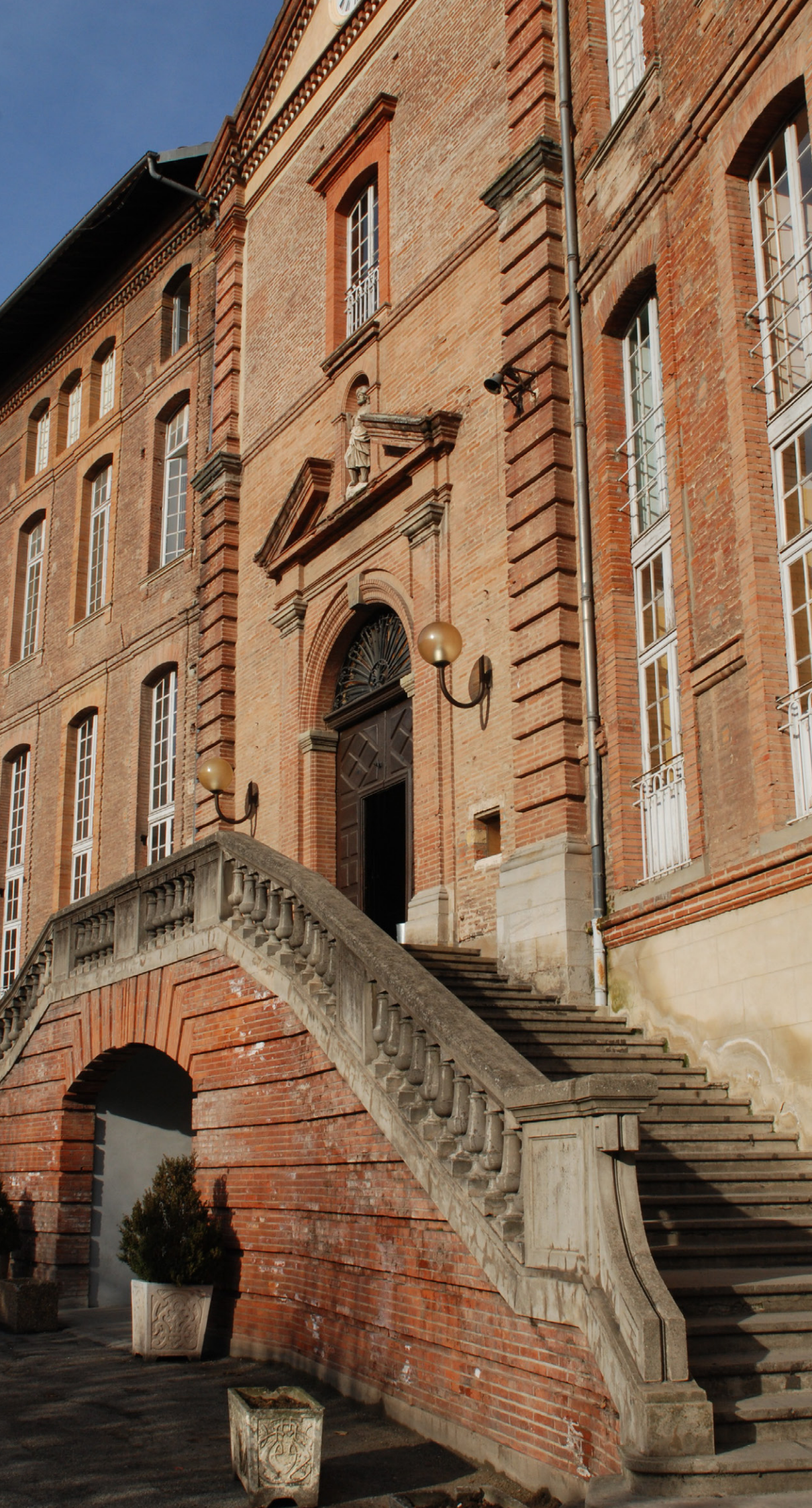
Conception graphique : No Screen Today / Boris Igelman